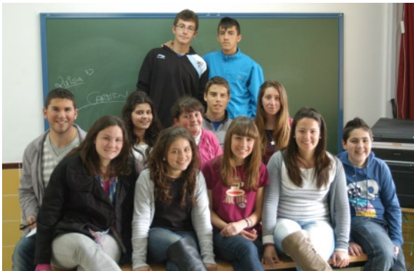
6 de mayo. 12:00h. Centro Cultural Provincial Taller de Teatro del IES María Victoria Atencia