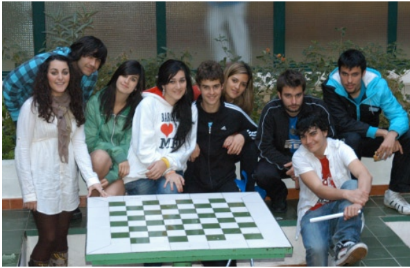
4 de mayo. 12:00h. Centro Cultural Provincial Taller de Teatro del IES Jesús Marín