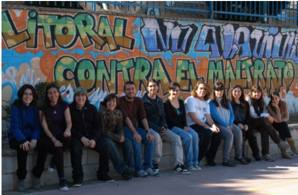
5 de mayo. 12:00h. Centro Cultural Provincial Taller de Teatro del IES Litoral